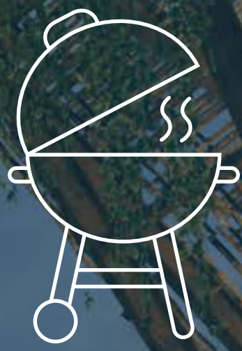
ÁREA DE ASADEROS