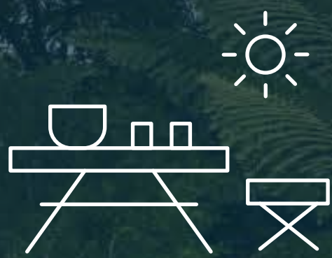
ÁREA DE PICNIC DE DÍA