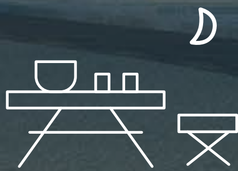
ÁREA DE PICNIC DE NOCHE